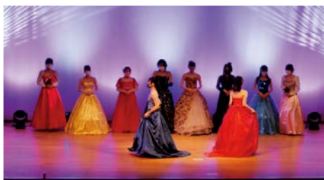
3年生 自作ドレスでのファッションショー