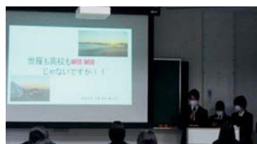
世羅町の活性化について（教育分野） ～世羅高校の行事に世羅町でのキャンプを～