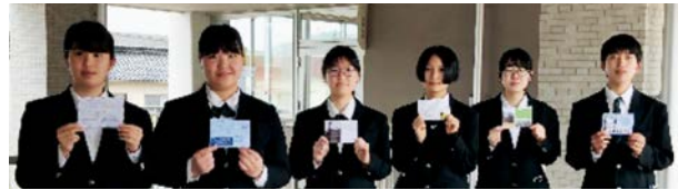
大同高級中学からポストカードが届きました

世羅高校では、国際化の時代に対応し、ニューヨークのソートン・ドノバン・スクールや台湾の大同高級中学、フランスのフォンティエヌ農業高校の生徒との国際交流を実施してきました。しかし、世界的なコロナ禍で、直接交流ができなくなり、姉妹校との直接の交流はできていませんが、メールでのやり取りやクリスマスカードなど、互いに送り合うことを通して、親睦を深めています。