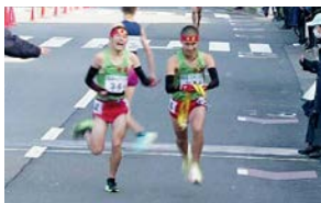
4区吉川から5区小島へリードを保つ

世羅はこのあとリードを守り、歴代2番目となる2時間1分21秒の好記録でフィニッシュし2年連続11回目の優勝を果たしました。優勝回数でも単独最多を更新しました。