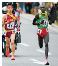
3区コスマス さらにリード拡げる