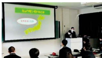
ヒョウモンモドキの保護を通じた地域活性化の提言 ～保護活動を通して私たちが考えたこと～

例年、各学科で問題解決や探究活動を主体的、創造的、協働的に取り組み、自己の在り方生き方を考える態度を養うことを目的として学習成果発表会を実施してきました。