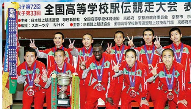
歴代2位のタイムで優勝した世羅高男子メンバー