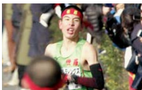
6区花岡のラストスパート