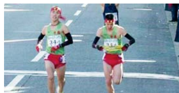
5区小島から6区花岡へトップのたすきリレー